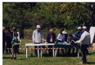
Tavolo della giuria

Le scuole interessate all'iniziativa potranno partecipare con un numero di 10 elementi senza fuori quota, dei quali 4