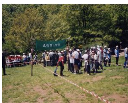
Immagine di precedenti edizioni

valide conoscenze sulla struttura e sulle peculiarità naturalistiche del Parco dei Nebrodi, per favorire in loro un corretto ed educativo rapporto di fruizione del patrimonio naturalistico.